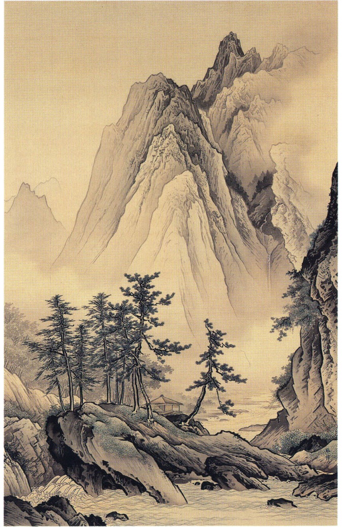
14 橋本雅邦 《夏冬山水図》 明治34年(1901)頃